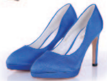
蓝色纱丁布女士单鞋